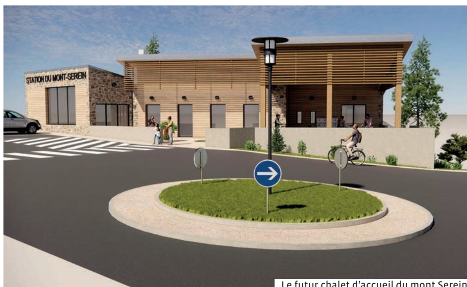
Le futur chalet d'accueil du mont Serein

Subventionné aux deux tiers, un programme d'investissement communautaire de 2 mil-