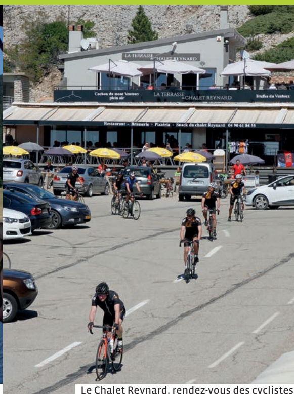
Le Chalet Reynard, rendez-vous des cyclistes