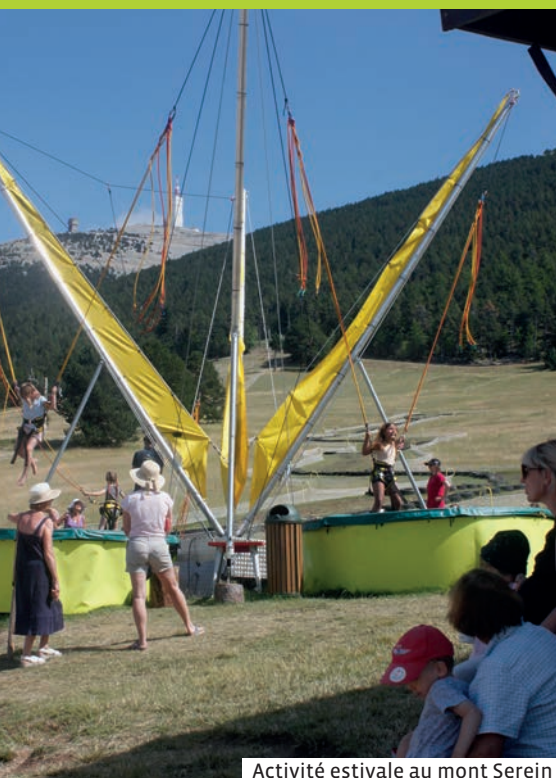
Activité estivale au mont Serein

Vous rêvez d'expériences aux sommets, d'un lever de soleil sur le Ventoux, d'une initiation à l'escalade dans les monts de Vaucluse, d'une randonnée familiale dans les Dentelles de Montmirail ? Alors, suivez le guide, en l'occurrence la CoVe. Depuis bientôt cinq ans, votre intercommunalité assure le développement de ces destinations touristiques de rêve.