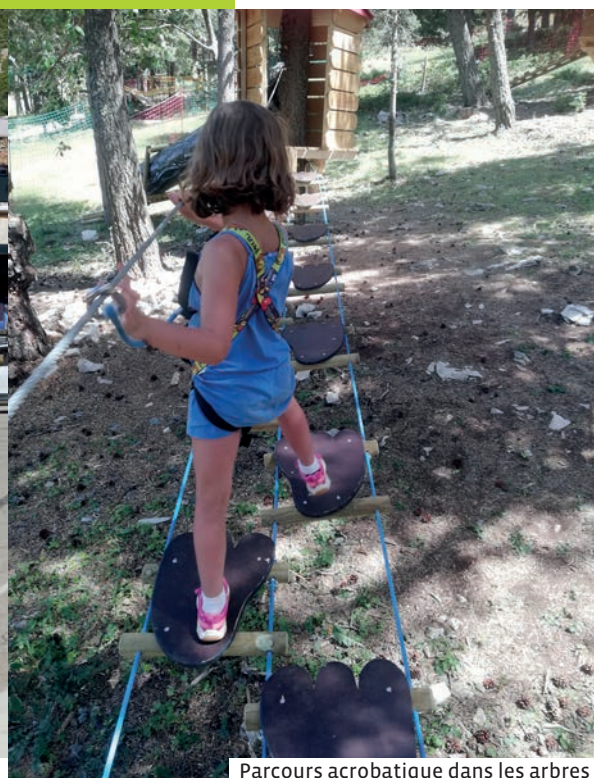
Parcours acrobatique dans les arbres

Passer d'un sentier d'ocre fine fragrance de lavandes en compagnie d'un guide naturaliste à une visite érudite de Carpentras dans les pas d'un champion du patrimoine, glisser d'une paisible balade à vélo sur la Via Venaissia à une dégustation gourmande dans un chai bien tempéré avant de regagner une confortable chambre d'hôte, comblé et ravi, c'est la logique choisie par les élus de la CoVe pour développer un tourisme d'idées et d'histoires, de découvertes et de goûts, un tourisme promoteur de notre art de vivre et respectueux de notre environnement. Les passerelles lancées pour mobiliser