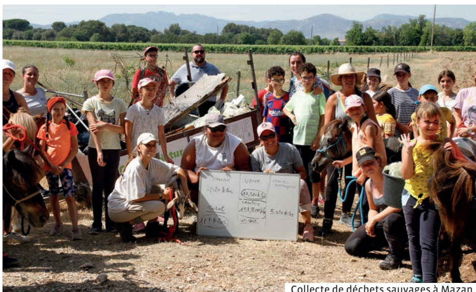
Collecte de déchets sauvages à Mazan.

« Depuis plusieurs années, dans les collèges et les lycées, le CISPD mène une sensibilisation au cyberharcèlement et aux dangers d'Internet dans le cadre d'un théâtre forum de la Compagnie des Autres. N'oublions pas les parents qui parfois n'arrivent plus à communiquer avec leurs adolescents. On leur propose donc un soutien auprès du Point d'Accueil et d'Écoute Jeunes Le Passage. Les adolescents peuvent également bénéficier d'un accueil et d'une écoute auprès du PAEJ. Nous finançons aussi l'association AILE pour accompagner au Code de la route des jeunes présentant des difficultés d'apprentissage. L'association Numa, elle, propose des ateliers sur les valeurs de la République et la laïcité. »