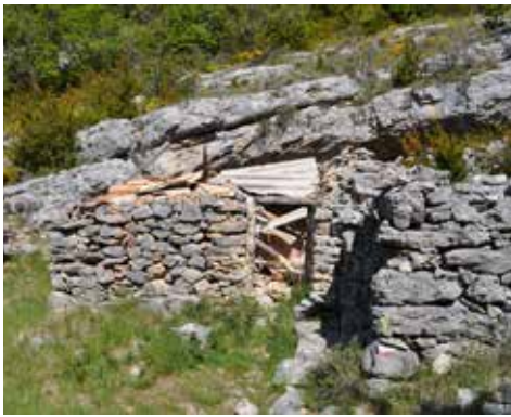
Jas de Baumasson