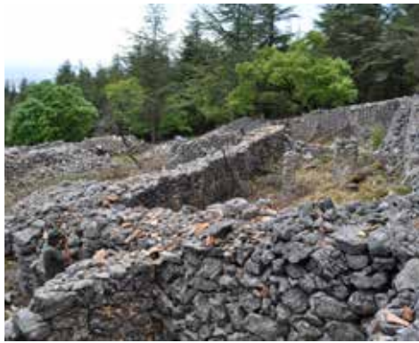
Jas du Serre