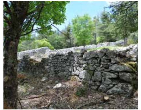
Jas du Serre