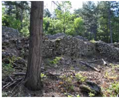
Jas de Favier