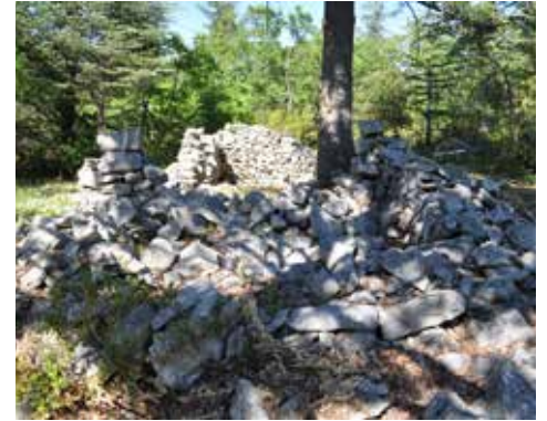
Jas de Chanvillard