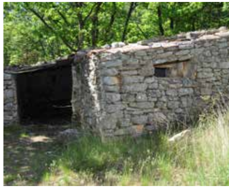
Jas de l'Abeyts