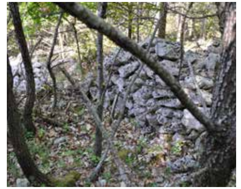
Jas des Marchands