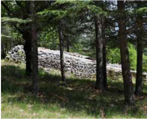
Jas du Noyer de Poutreuil