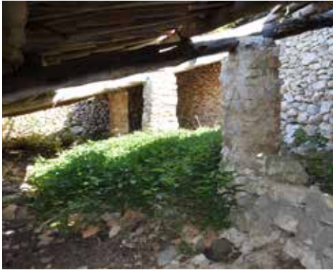
Jas des Landérots