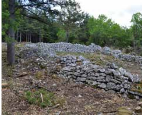
Jas de Roubin