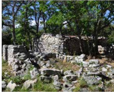
Jas de Chanvillard