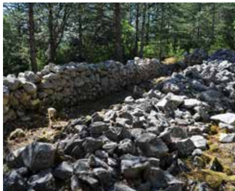
Jas de Bonin