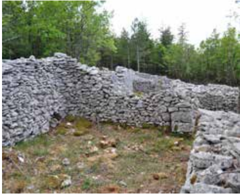
Jas de Roubin