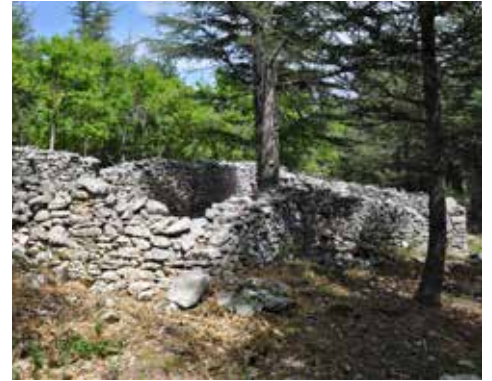
Jas de Remelin