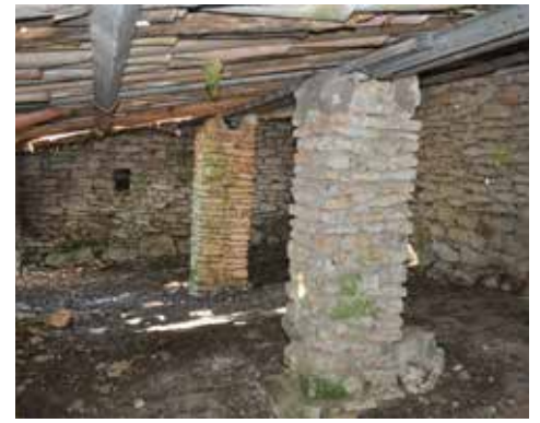
Jas de l'Abeyts