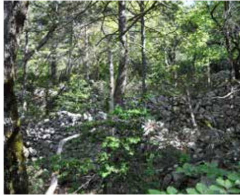
Jas des Mians