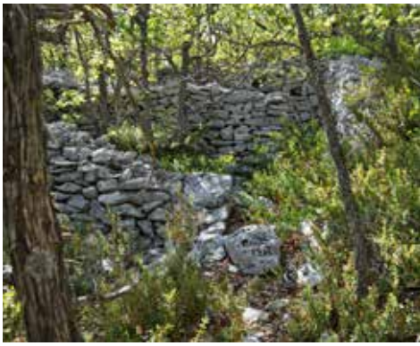
Jas de Jean Bau