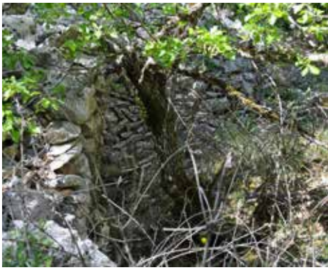
Jas de Remelin