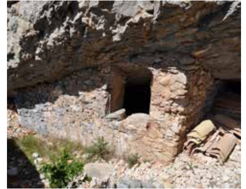
Jas de Baumasson