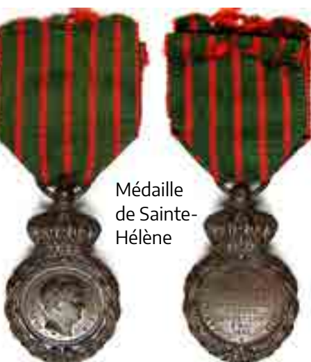
Médaille de Sainte-Hélène