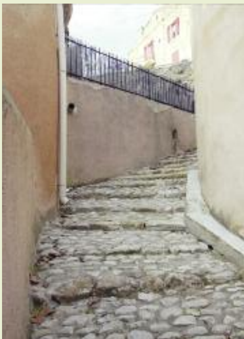
Calade, rue de la Rocaille

Précisons que le coût des travaux en cours a été inscrit au budget communal pour un montant de 500 000 € couvert par l'autofinancement communal et par les subventions attribuées ou en cours d'attribution du Conseil Général (151 000 €).