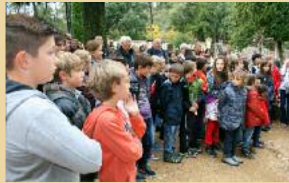
Les enfants des écoles à la cérémonie du 11 novembre au cimetière de Bédoin

Début décembre, c'est avec un grand plaisir que nous avons offert aux enfants un spectacle interactif de Noël, tout en musique, chansons, marionnettes, puzzle et rires : " Père Noël ! Où es-tu ? ", organisé par la bibliothèque.