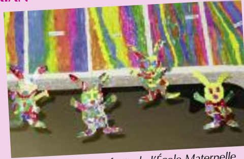
Dessin des enfants de l'École Maternelle