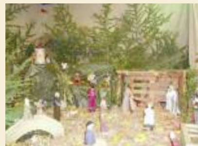
Crèche de Sainte Colombe

du 22 décembre au 4 janvier inclus de 15 h à 17 h