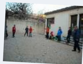
Les enfants des écoles en Temps d'Activités Périscolaires