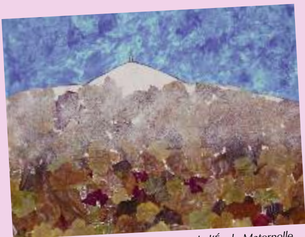
Le Ventout, dessin des enfants de l'École Maternelle