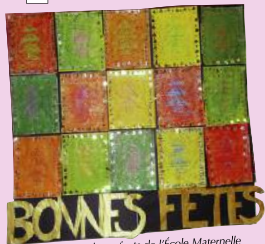
Dessin des enfants de l'École Maternelle