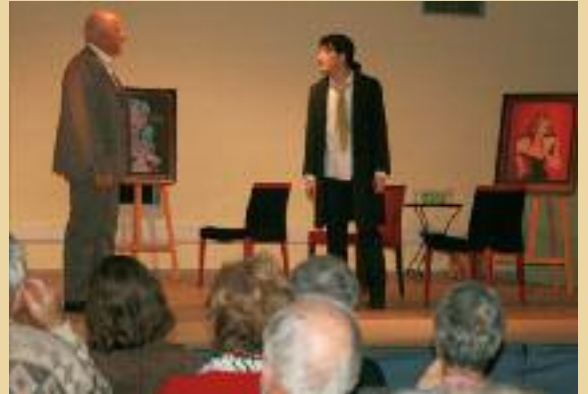
Représentation du Misanthrope par la compagnie Jean Thomas le 29 novembre au Centre Culturel de Bédoin

le beau texte du « Misanthrope » de Molière, dirigé par Michel PAUME qui avait pris le parti de la sobriété dans sa mise en scène et le jeu de ses acteurs. Pas de costume, mais des vêtements intemporels ainsi qu'un décor dépouillé plutôt contemporain, permettant de fixer l'attention du public et sa concentration sur le texte tout en alexandrins. La troupe a été applaudie longuement par un public amateur de bon théâtre. Nous aurons l'occasion de revoir cette troupe prochainement à Bédoin dans l'une de ses dernières créations.