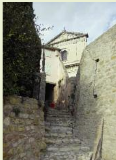
Traverse de l'église