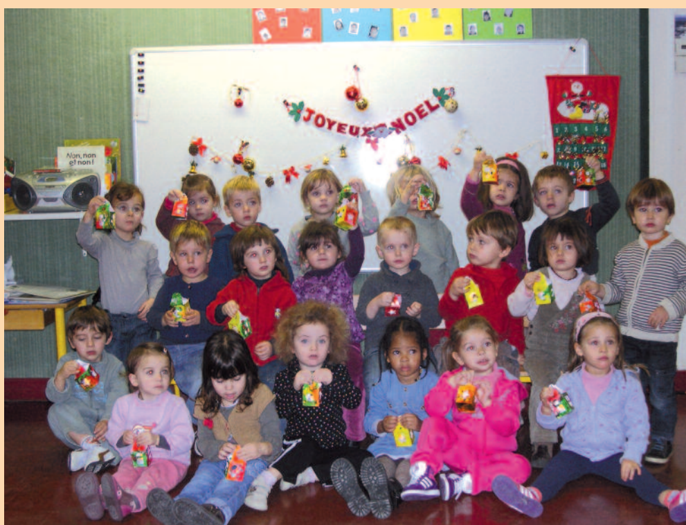
Les enfants de l'école maternelle

Pour préparer cette visite un courrier nominatif a été adressé aux personnes concernées avec un coupon-réponse à retourner au syndicat dans les meilleurs délais.