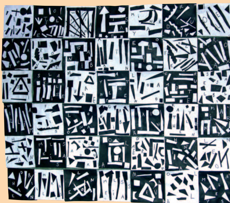
Réalisation des enfants de l'école maternelle