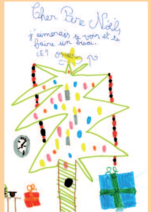
La classe CM2 d'Arlène MEYSTRE

(En espérant que le Yéti ne se réveillera jamais plus...)