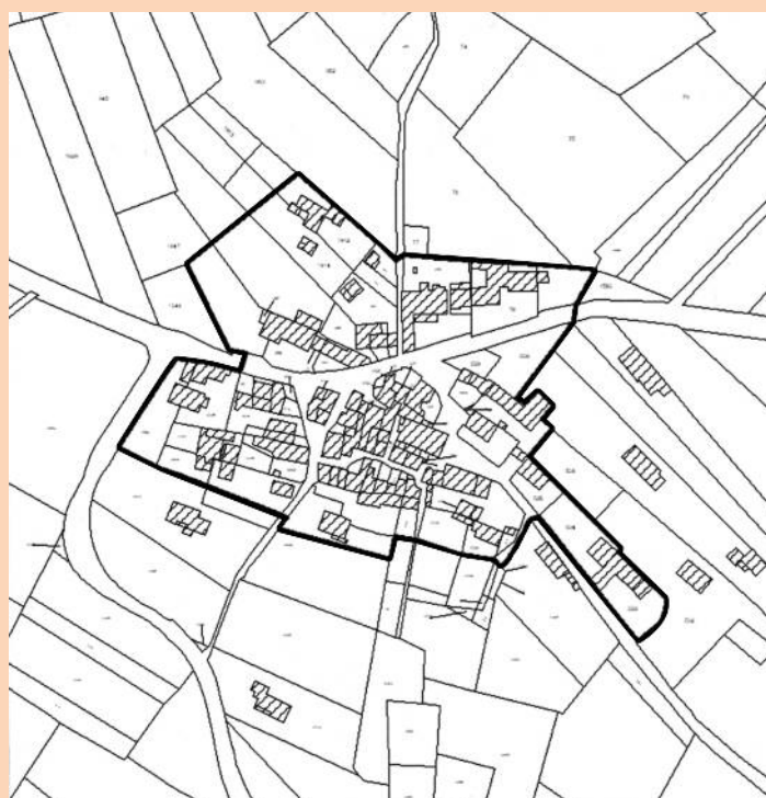
Hameau de Ste Colombe

Le taux est de 30 % d'un montant de travaux plafonnés à 7 623 € TTC, soit 2 287 € de subvention maximale.