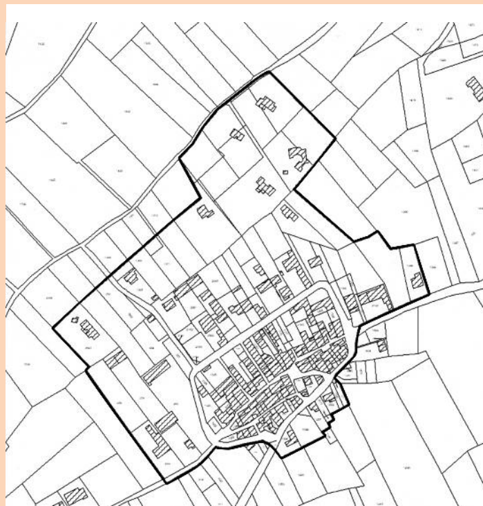
Hameau des Baux

Vous pouvez également la joindre tous les jeudis au 04 90 23 12 12.