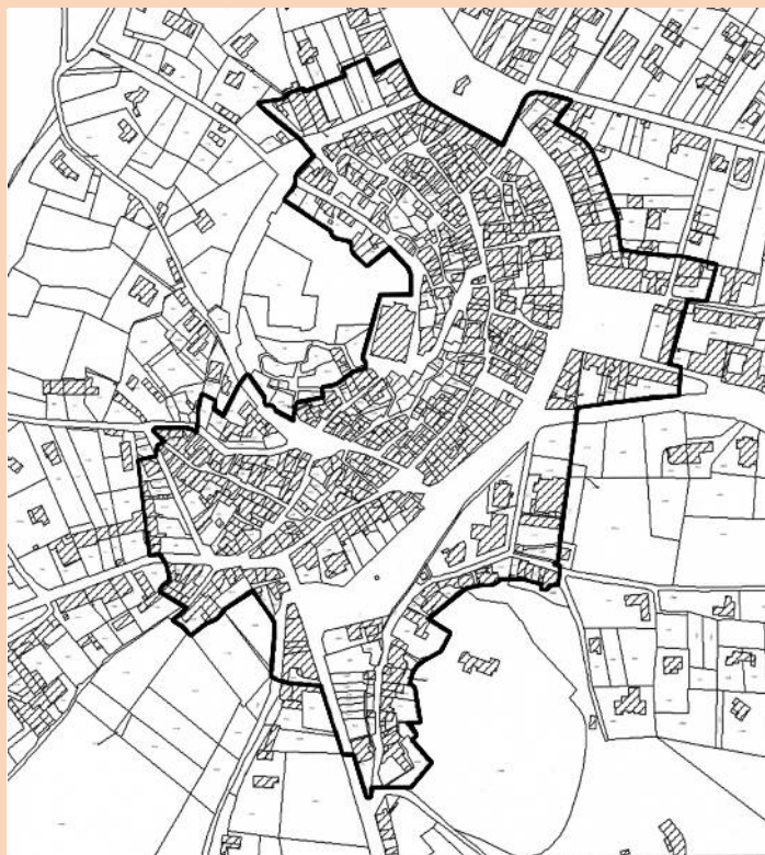
Centre de Bédoin

La commune accorde, avec le soutien du Conseil Général et du Conseil Régional, une subvention pour tout type de bâtiment (logement, commerce, remise...) quelle que soit la nature de l'occupation et sans conditions de ressources du demandeur.