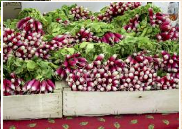
Le marché de Bedoin