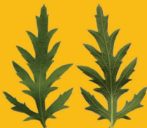
1 psilostachya Peu divisées