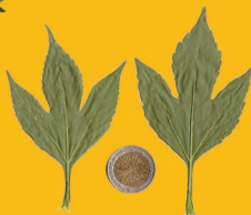
3 trifida De grande taille, de 1 à 5 lobes