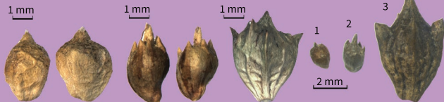
❶ psilostachya ❷ artemisiifolia ❸ trifida